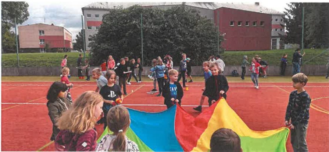
HRÁTKY s ŠD při ZŠ