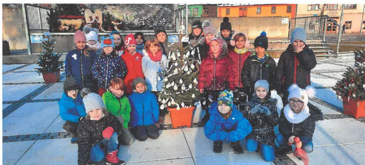
ZDOBNĚNÍ VÁNOČNÍCH STROMKŮ