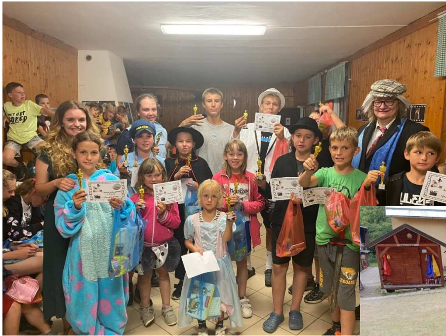
TÁBOR NA ONDRÁŠI