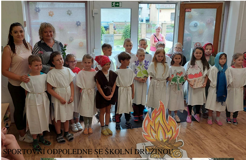
SPORTOVNÍ ODPOLEDNE SE ŠKOLNÍ DRUŽINOU